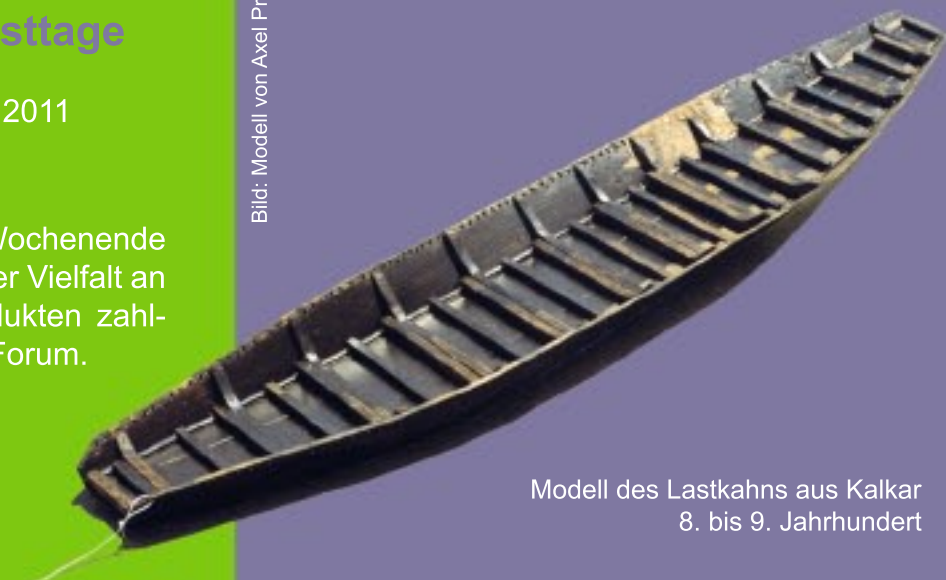
Modell des Lastkahns aus Kalkar 8. bis 9. Jahrhundert

Die Ausstellung vermittelt die wesentlichen technischen Entwicklungen der skandinavischen Langschiffe und deren Verwendung im Vergleich zu den Schiffstypen im frühmittelalterlichen Mitteleuropa und stellt die niederrheinische Funde dieser Zeit vor.